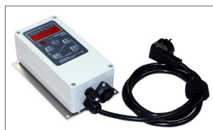
Leveres med/ uden kontrol enhed til temperatur styring.