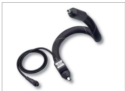
El-trace slangen er velegnet til limning af emballage på pakkeanlæg. Slangen kan leveres til alle gængse fabrikater.