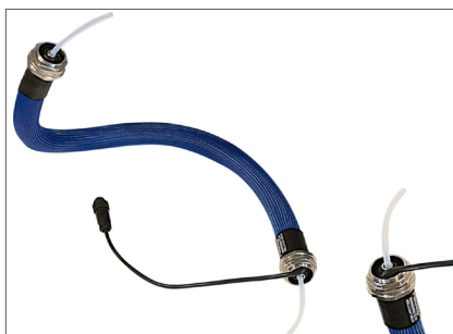
El-trace kappe monteret med FDA godkendt slange op til Ø12 mm udvendigt. Den indvendige slange kan udskiftes efter behov og den opvarmede kappe kan efterfølgende genanvendes.